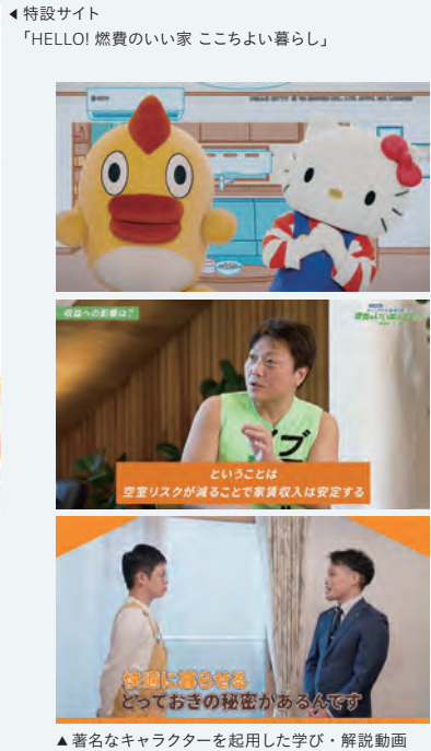
▲ 著名なキャラクターを起用した学び・解説動画