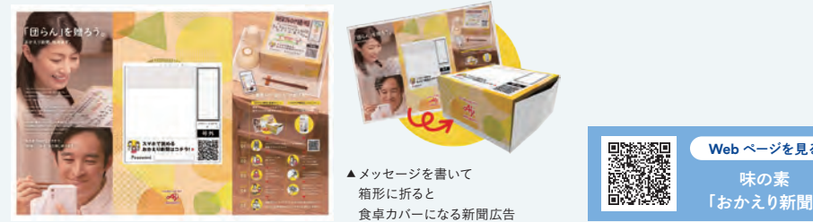
▲ メッセージを書いて箱形に折ると食卓カバーになる新聞広告