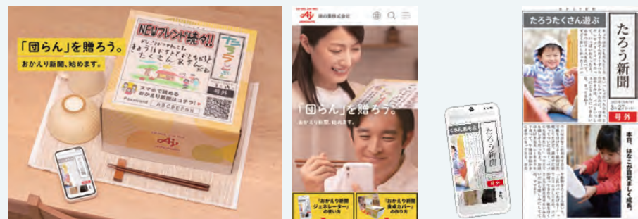
▲ おかえり新聞ジェネレーター

ライフスタイルの多様化に伴い、様々な理由で「家族と一緒に食事したくてもできない」方に向けて、新しい形の“団らん”を提案できないか検討。“共食”がもたらす「家族との心の繋がり」「家族とのコミュニケーション」を体験できる施策「おかえり新聞」をYBSでプロデュースしました。見開きの新聞広告は、メッセージを書いて折りたたむとオリジナルの「おかえり新聞 食卓カバー」になり、遅れて帰ってくる家族に気持ちを伝えたり、温かいひと言を添えたりできる新しい形のコミュニケーションツールとなります。また写真とメッセージを入力することで、簡単にオリジナルのデジタル新聞を制作できる「おかえり新聞 ジェネレーター」を開発。食事中に家族で話したかった「その日の出来事」をデジタル新聞を通して伝えることができます。(広告主：味の素株式会社)