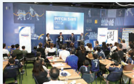
▲公開収録イベントの様子