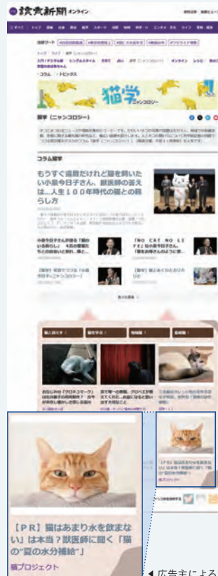
▲広告主によるPRコンテンツ